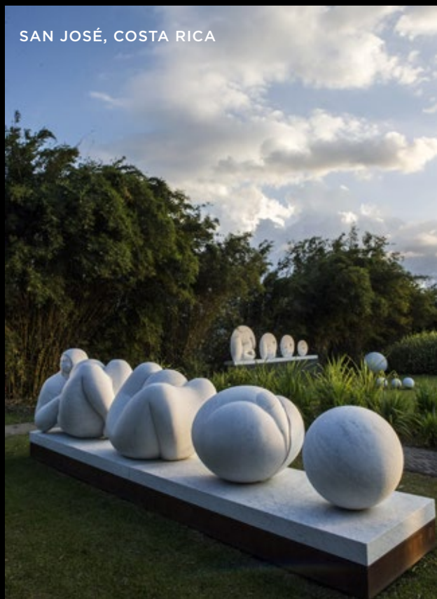
SAN JOSÉ, COSTA RICA