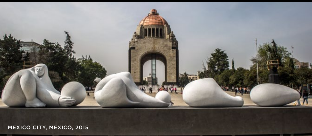
MEXICO CITY, MEXICO, 2015