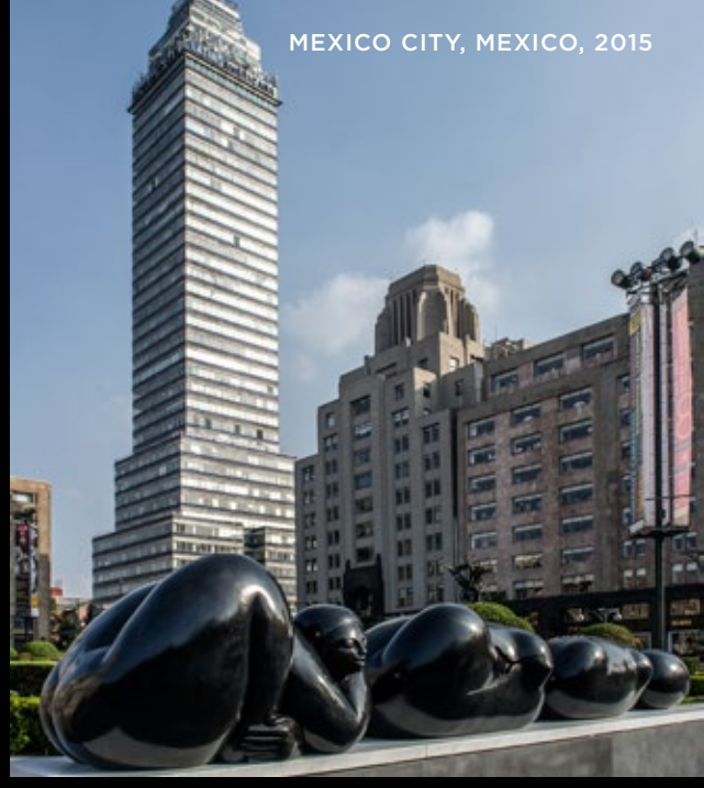
MEXICO CITY, MEXICO, 2015