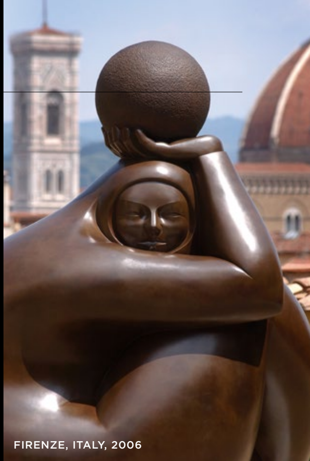
FIRENZE, ITALY, 2006