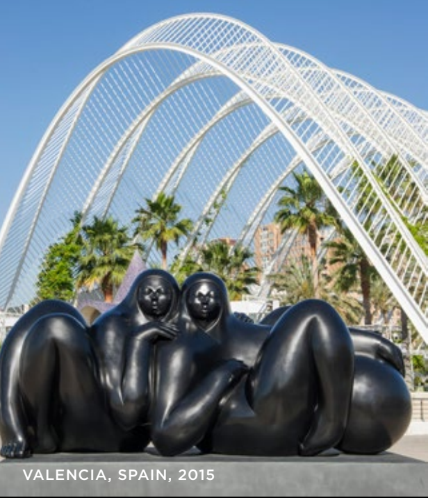
VALENCIA, SPAIN, 2015