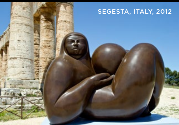
SEGESTA, ITALY, 2012