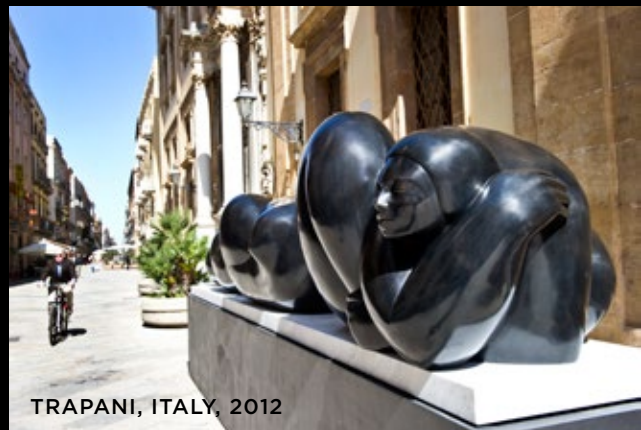
TRAPANI, ITALY, 2012